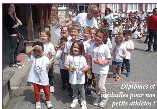
Diplômes et médailles pour nos petits athlètes !