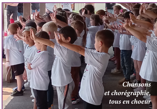
Chansons et chorégraphie, tous en coeur