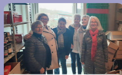
La totalité des boîtes a été remise à l'équipe du Secours Populaire de Louviers.