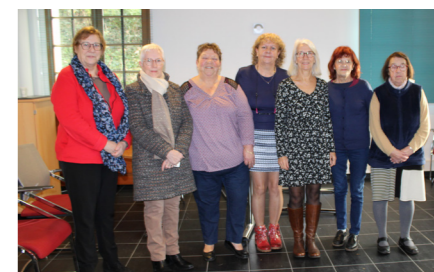
Les membres du CCAS réunis dans la salle du conseil municipal, lors de la remise des bons cadeaux aux bénéficiaires.

Les exposants étaient nombreux à proposer des articles à destination des enfants à des prix vraiment très abordables !