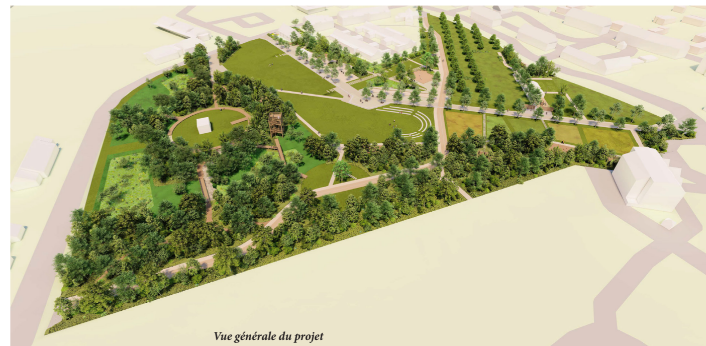
Vue générale du projet